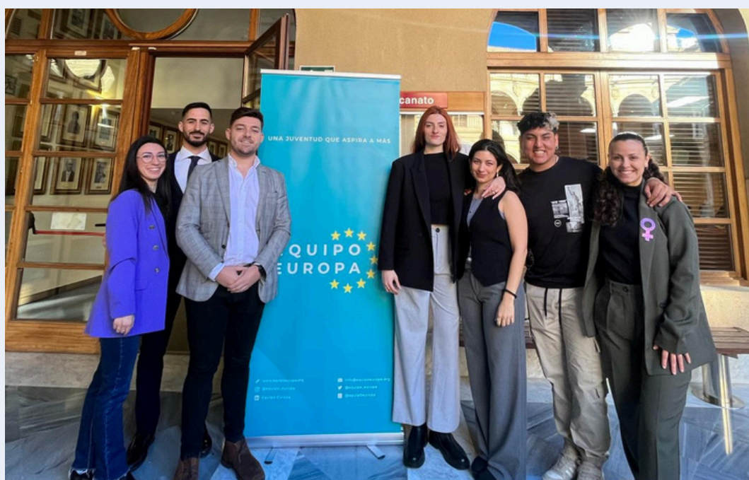
Imagen de los organizadores de la fase regional de las II Olimpiadas de la UE del curso 23/24 en la Región de Murcia , celebrada en la Sala de vistas de la Facultad de Derecho (UMU)